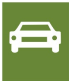
Strasse mit einer Fahrbahn