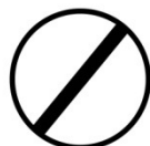
Aufhebung aller Streckenverbote