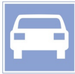
Nur für KFZ