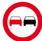
Überholverbot für KFZ