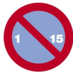
Parkverbot vom 1. bis 15. des Monats