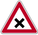
Kreuzung mit „Rechts vor Links“ Regel