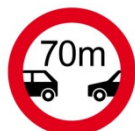
Verbot des Fahrens ohne einen Mindestabstand