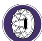
Schneeketten sind vorgeschrieben